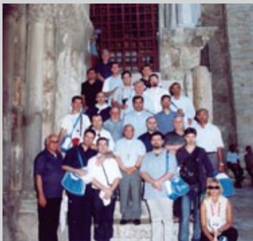
Pellegrini della Diocesi di Ariano Irpino in visita al Santo Sepolcro in occasione del pellegrinaggio in Terra Santa del 4 luglio 2005