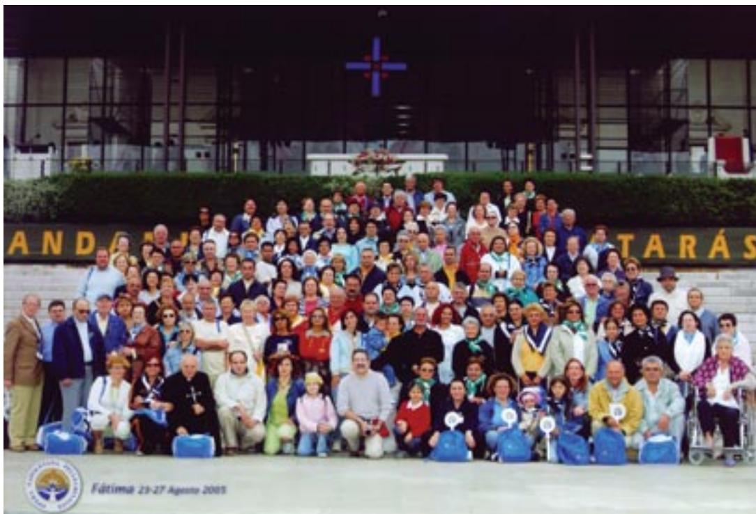
a sinistra - il gruppo di fedeli che hanno partecipato al pellegrinaggio a Fatima il 23 agosto 2005