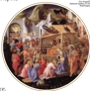
L'Adorazione dei Magi Fra Angelico National Gallery of Art, Washington

nella ricorrenza della nascita del Cristo Salvatore la direzione ed i collaboratori dell'Opera Napoletana Pellegrinaggi inviano sentiti auguri auspicando per tutti gioia, serenità e pace.