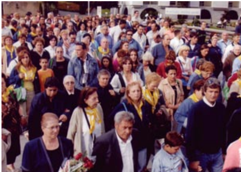
sopra - un'immagine del convegno e lo stand realizzato dall'ONP in occasione della Borsa del Turismo Religioso organizzata a San Giovanni Rotondo.

odierna per rispondere ai rischi di un certo processo di secolarizzazione e all'urgenza di educazione alla fede, per far crescere in tutti la consapevolezza di sentirsi popolo di Dio, Santuario di Dio, e favorire così la crescita umana e spirituale”. “E allora”, ha proseguito il Prof. Stagliano, “dovremmo guardare ai Santuari con molta attenzione, perché essi sono il segno esterno necessario alle nostre povere condizioni umane per vedere qualcosa di quell'altro Santuario”. “L'Eucaristia dovrà essere al centro del pellegrinaggio, in quanto fonte della vita del cristiano, da cui attingere ritualmente la forza e il culmine di una vita che diventa dono, che diventa amore, che visibilizza e dà corpo alla misericordia”.