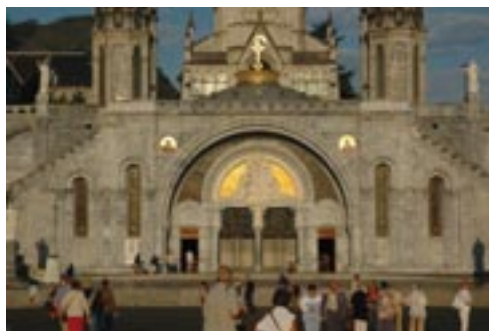
sopra - Il Santuario di Lourdes