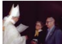
sopra - S.Em.za il Cardinale Michele Giordano celebra il Rinnovo delle Promesse di Matrimonio. in alto a sinistra - La Grotta di Massabielle. in basso - Il Santuario.

Non si spiegherebbe lo strumento primario come nel caso di Bernadette, letta nel suo contesto rimanda con tutta la sua esistenza alla logica della scelta di Dio che sconvolge i piani e la logica dell'uomo e indicazione di