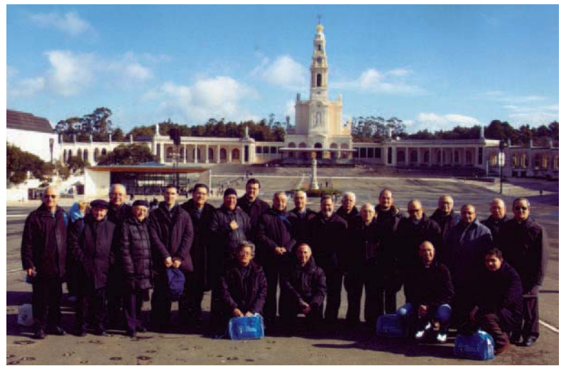
sopra - Pellegrinaggio dei sacerdoti napoletani organizzato dall'ONP nel febbraio 2006 in occasione della traslazione del corpo di Suor Lucia da Coimbra a Fatima.

Colpisce l'umiltà che li accomuna, a qualunque latitudine, la semplicità