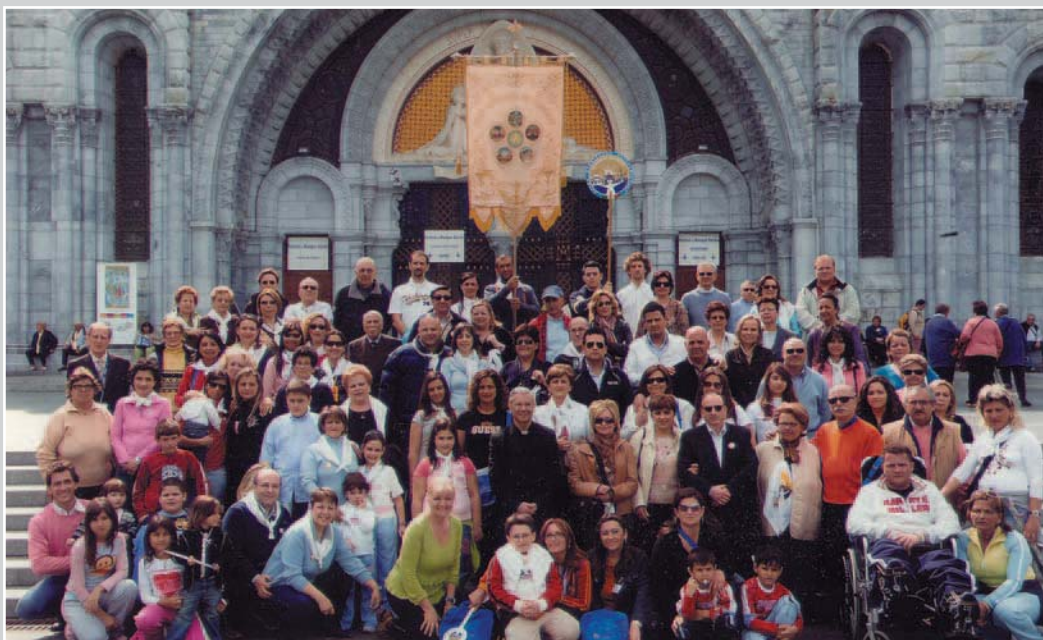
sopra - Un gruppo dell'ONP a Lourdes

La processione eucaristica si svolge tutti i pomeriggi alle 16,30 - nel periodo dei pellegrinaggi - e rappresenta il momento più toccante; non a caso parte di fronte alla Grotta, oltre il fiume, con in testa le carrozzine dei malati, gli stendardi delle associazioni mariane, seguita da tutto il popolo di Dio. Prosegue lungo il fiume Gave, gremisce l'Esplanade, per poi terminare nella Basilica di San Pio X con l'esposizione del Santissimo Sacramento e la benedizione solenne. Proprio durante questa celebrazione religiosa si è avuto il maggior numero di miracoli. Tutti invocano l'intercessione della Madre di Gesù per avere la guarigione del corpo o dello spirito; infatti i veri protagonisti di Lourdes sono i malati. Lourdes non è un ospedale a cielo aperto dove le sofferenze del mondo sono messe in mostra. Anzi, a differenza di un vero ospedale, non c'è tristezza, perché spesso le preghiere dei malati non sono per se stessi, ma per gli altri. È vero, l'infelicità impera in questo mondo, ma bisogna combatterla. Con quali strumenti? Certo siamo deboli e non sappiamo resistere alle