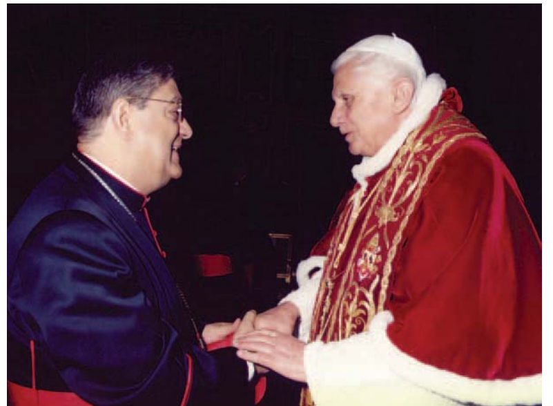
sopra - Il Cardinale Crescenzio Sepe con il Santo Padre Benedetto XVI.

Nel 1997 Gli è stata conferita la nomina a Segretario Generale del Comitato e del Consiglio di Presidenza del Grande Giubileo dell'Anno 2000 ed ha seguito in prima persona sia l'itinerario di preparazione che l'organizzazione di questo Evento straordinario. È stato anche Presidente della Peregrinatio ad Petri Sedem dal novembre 1997 al luglio 2001. Creato Cardinale da Giovanni Paolo II nel Concistoro del febbraio 2001, nell'aprile dello stesso anno è stato nominato Prefetto della Congregazione per l'Evangelizzazione dei Popoli ed è anche Gran Cancelliere della Pontificia Università Urbaniana.