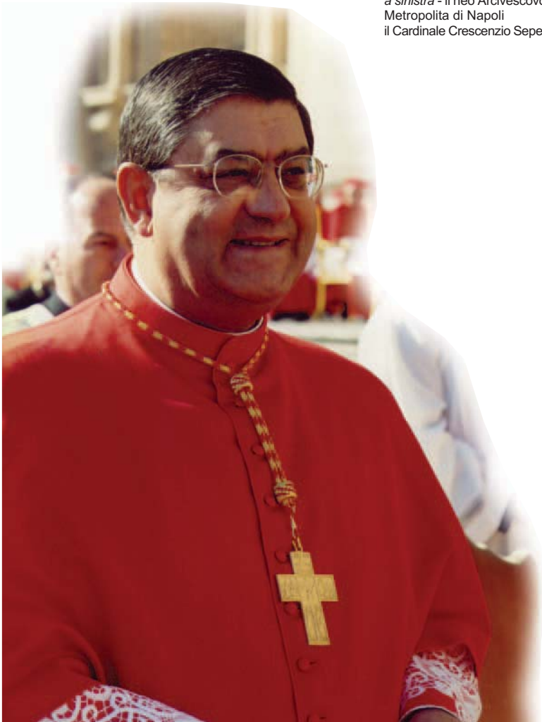
a sinistra - il neo Arcivescovo Metropolita di Napoli il Cardinale Crescenzio Sepe.

La Diocesi si prepara ad accogliere il suo Pastore sabato 1° luglio